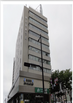
就労移行支援 ジョブサポート天神 天神にある毎日福岡会館ビルの7階