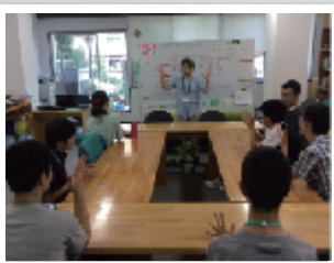
放課後等デイサービス フィット馬出 ジョブサポート馬出があるビルの2階